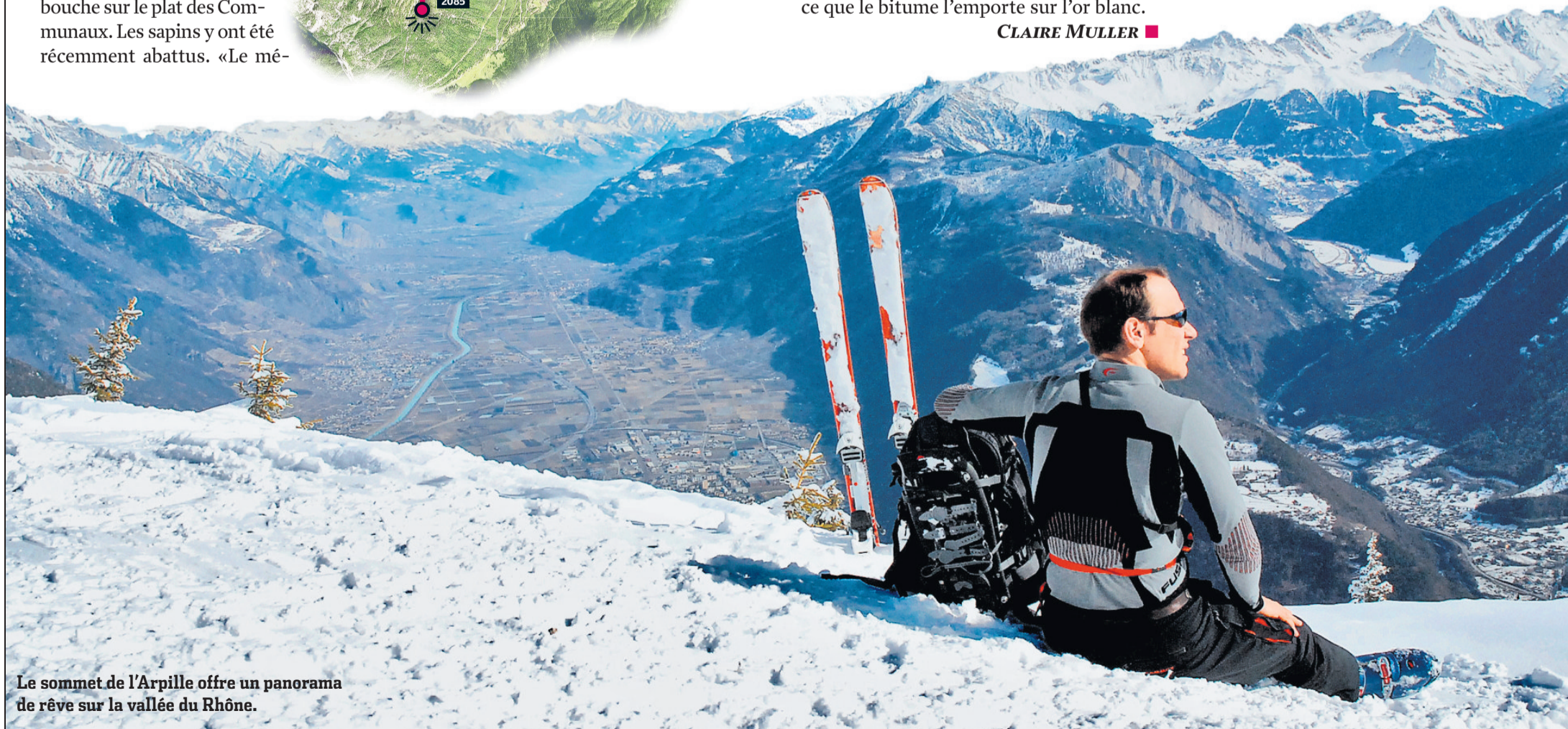
Le sommet de l'Arpille offre un panorama de rêve sur la vallée du Rhône.