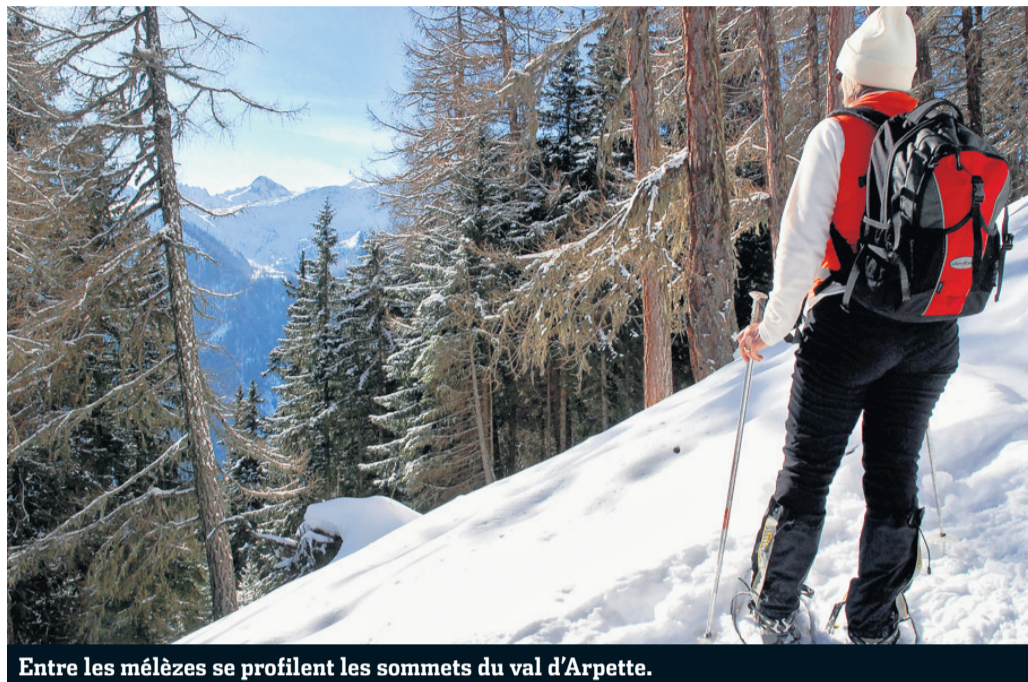
Entre les mélèzes se profilent les sommets du val d'Arpette.

Au départ du réservoir de Ravoire, la piste balisée grimpe à travers les sapins et coupe à plusieurs reprises la route forestière. Après avoir traversé une zone de mayens, profitons d'une forêt moins dense qui offre sur son flanc ouest des fenêtres sur les sommets du val d'Arpette. Le souffle court, on écoute quelques instants le pic épeiche, la mésange boréale ou le bec-croisé chanter l'arrivée des beaux jours. Le sentier débouche sur le plat des Communaux. Les sapins y ont été récemment abattus. «Le mé-